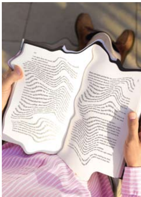
Lire peut se révéler difficile lorsque l'on souffre de la DMLA.

Si vous pensez que votre vue se détériore, ne tardez pas à consulter votre ophtalmologue. Il pourrait s'agir des premiers signes de la Dégénérescence Maculaire Liée à l'Âge (DMLA) et plus particulièrement de la forme «humide» (DMLA humide), plus rapide dans son développement, plus destructrice et la principale cause de perte de vue chez les plus de 60 ans dans les pays développés.