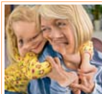
Vision déformée due à la DMLA.