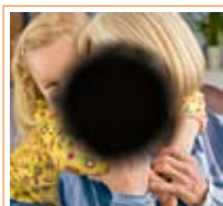
Vision au stade avancé de la DMLA.

Le développement de la DMLA est insidieux. Elle peut en effet affecter le premier œil sans que l'on s'en aperçoive et ce n'est souvent que lorsque le deuxième œil développe des symptômes que l'on repère le problème. Malheureusement, il est souvent trop tard pour soigner le premier œil! Voilà pourquoi il est si important, au-delà de 60 ans, de faire chaque année un examen des yeux pour dépister au plus vite les premiers symptômes de la DMLA.